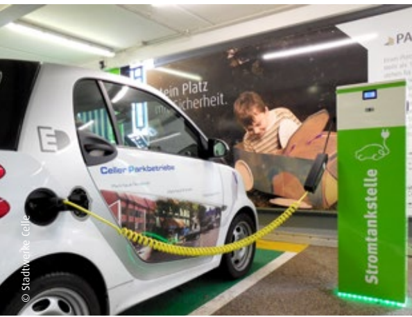
Energietankstelle: An jeder Ladesäule passt ein Schuko-stecker (16 Ampere), sowie ein Typ-2-Stecker (32 Ampere). So können gleich zwei Fahrzeuge parallel tanken.

An drei Stromtankstellen können Elektrofahrzeuge kostenlos aufladen.