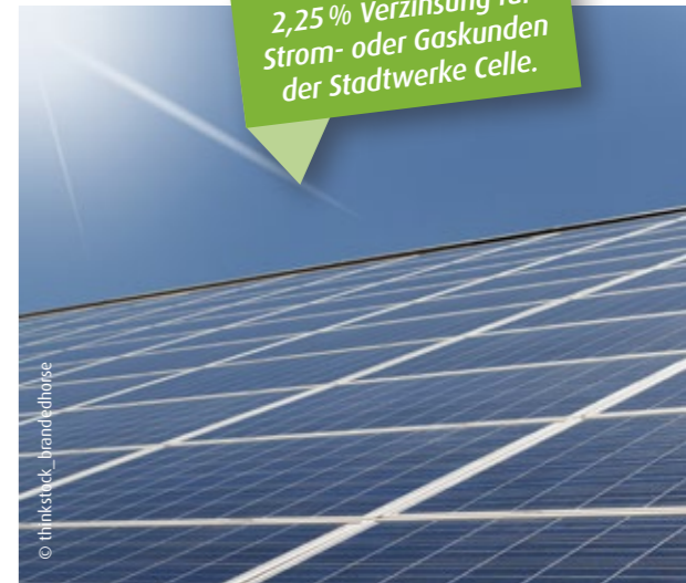
Attraktive Anlage: Von unserem Bürgerbeteiligungsmodell profitiert die Energiewende vor Ort und zugleich Ihr Portemonnaie.

2,25 % Verzinsung für Strom- oder Gaskunden der Stadtwerke Celle.