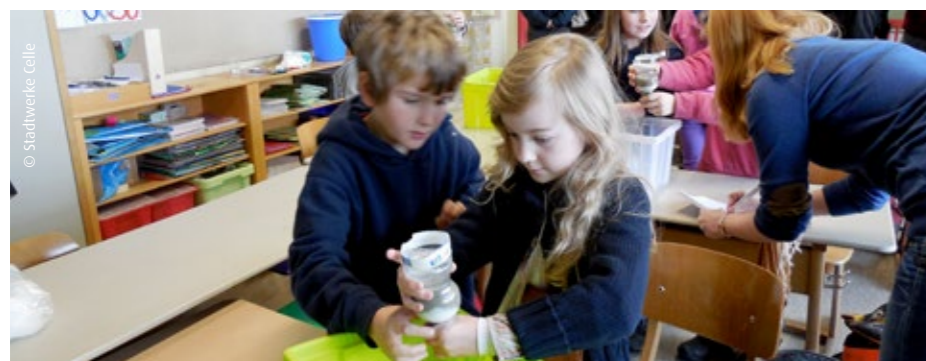
Langweilig wird es den Schülern bei dieser Lehrstunde nicht: mitmachen, ausprobieren, verstehen.